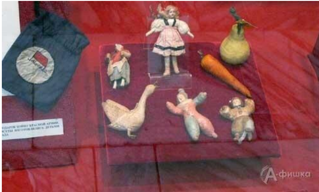
Новогодние подарки-игрушки детям блокадного Ленинграда.

Главную елку в Аничковом дворце украсили игрушками из папье-маше довоенного производства.