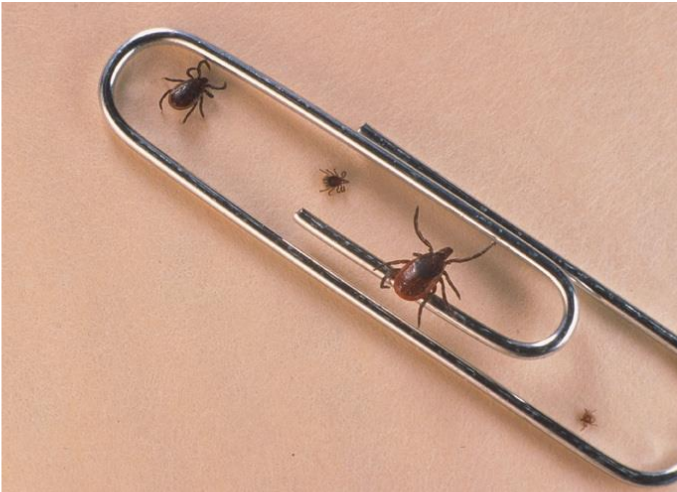
Самец, нимфа, самка и личинка клеща

Длина тела голодных самок клещей рода Ixodes – от 1,5 до 6 мм, напившихся самок – до 11мм. Тело покрыто мощным панцирем и снабжено четырьмя парами ног. У самок покровы задней части способны сильно растягиваться, что позволяет им поглощать большие количества крови, в сотни раз больше чем весит голодный клещ.