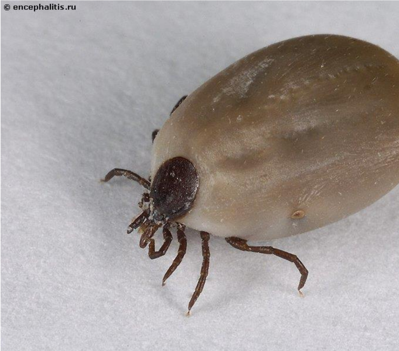
Напившаяся крови самка клеща

Самцы несколько меньше по размеру чем самки и присасываются лишь на короткое время (менее часа). Различить самку и самца весьма просто - надо запомнить, как они выглядят. В окружающем мире клещи ориентируются в основном с помощью осязания и обоняния, глаз у клещей нет. Зато обоняние клещей очень острое: исследования показали, что клещи способны чувствовать запах животного или человека на расстоянии около 10 метров.