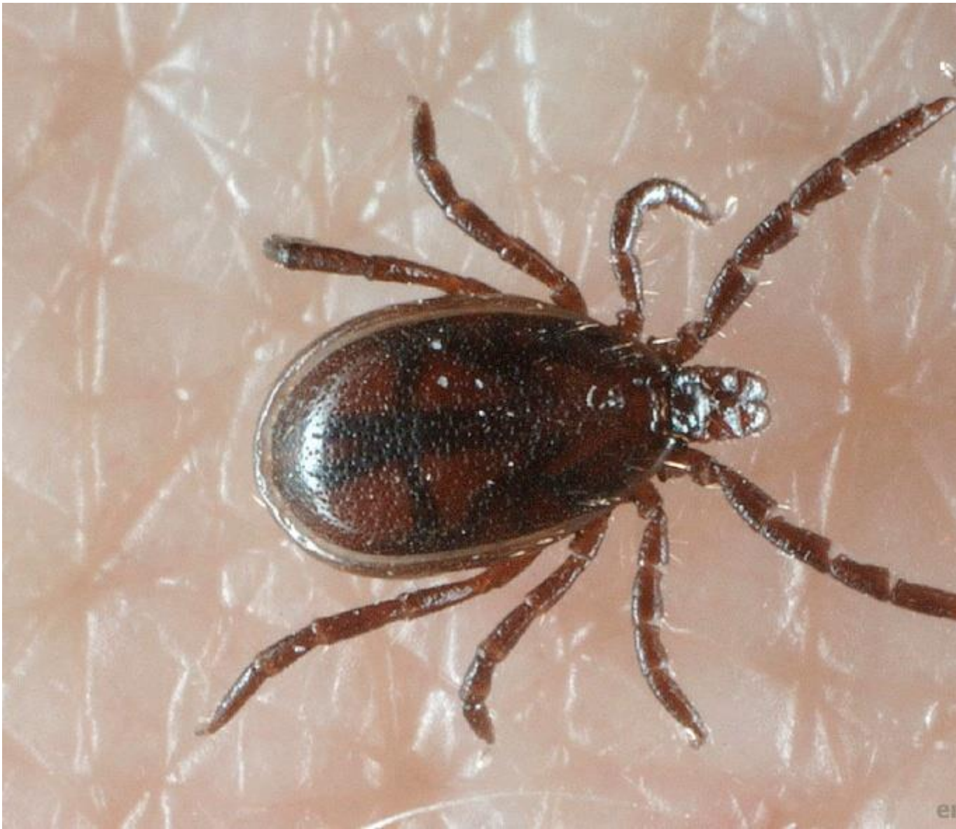
Самец клеща рода Ixodes